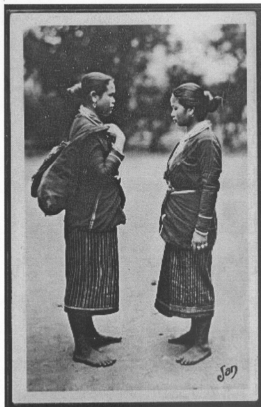
19th-Century Laotian Women